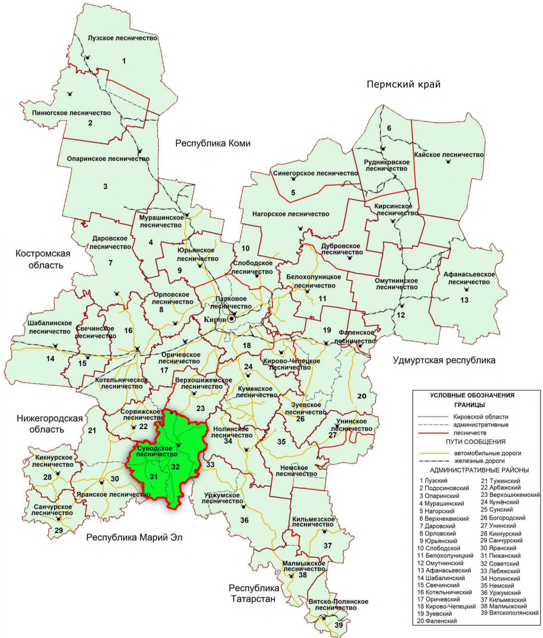
Рисунок 1. Карта-схема Кировской области с выделением территории расположения Суводского лесничества