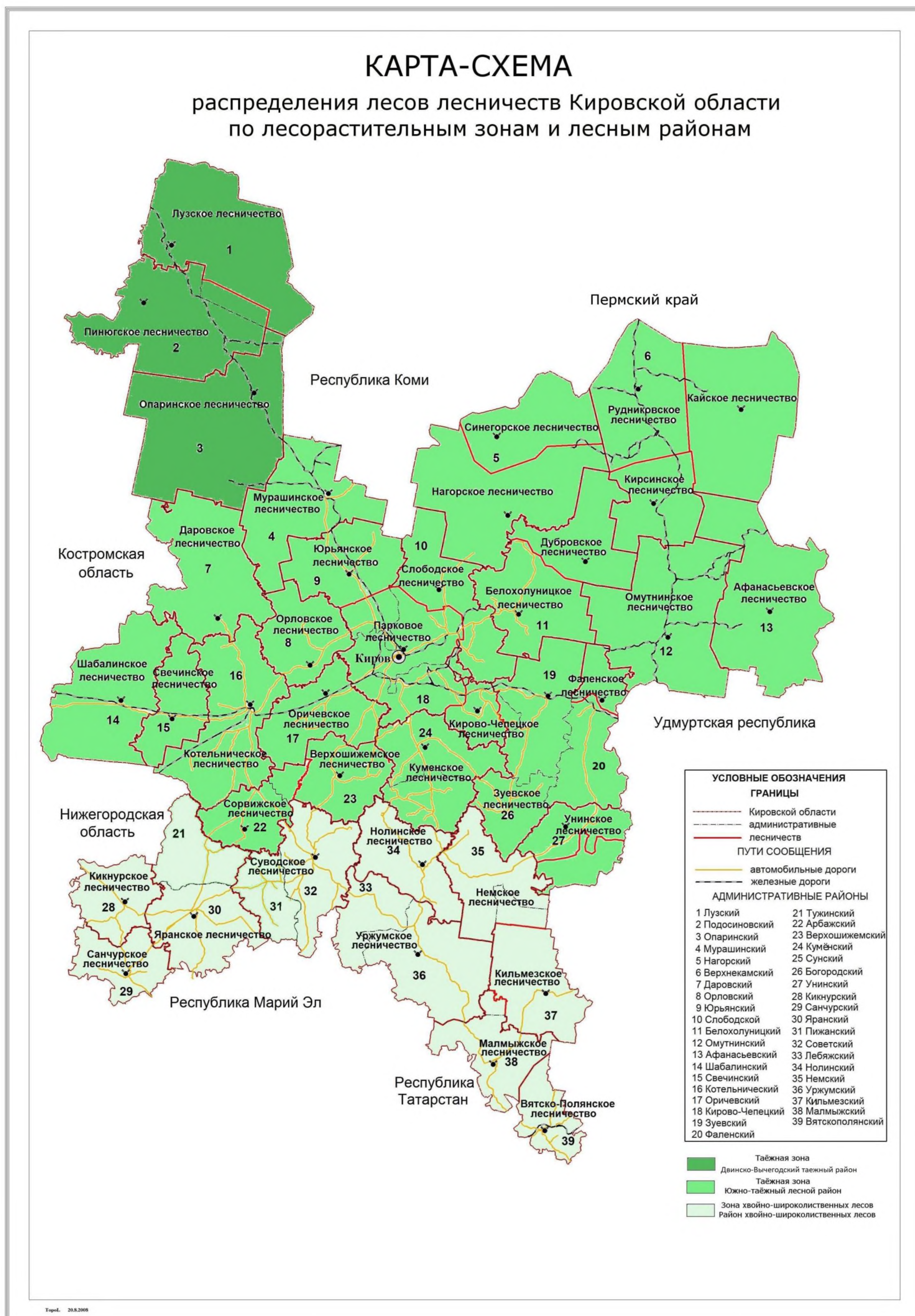
Рисунок 2. Распределение лесов лесничеств Кировской области по лесорастительным зонам и лесным районам