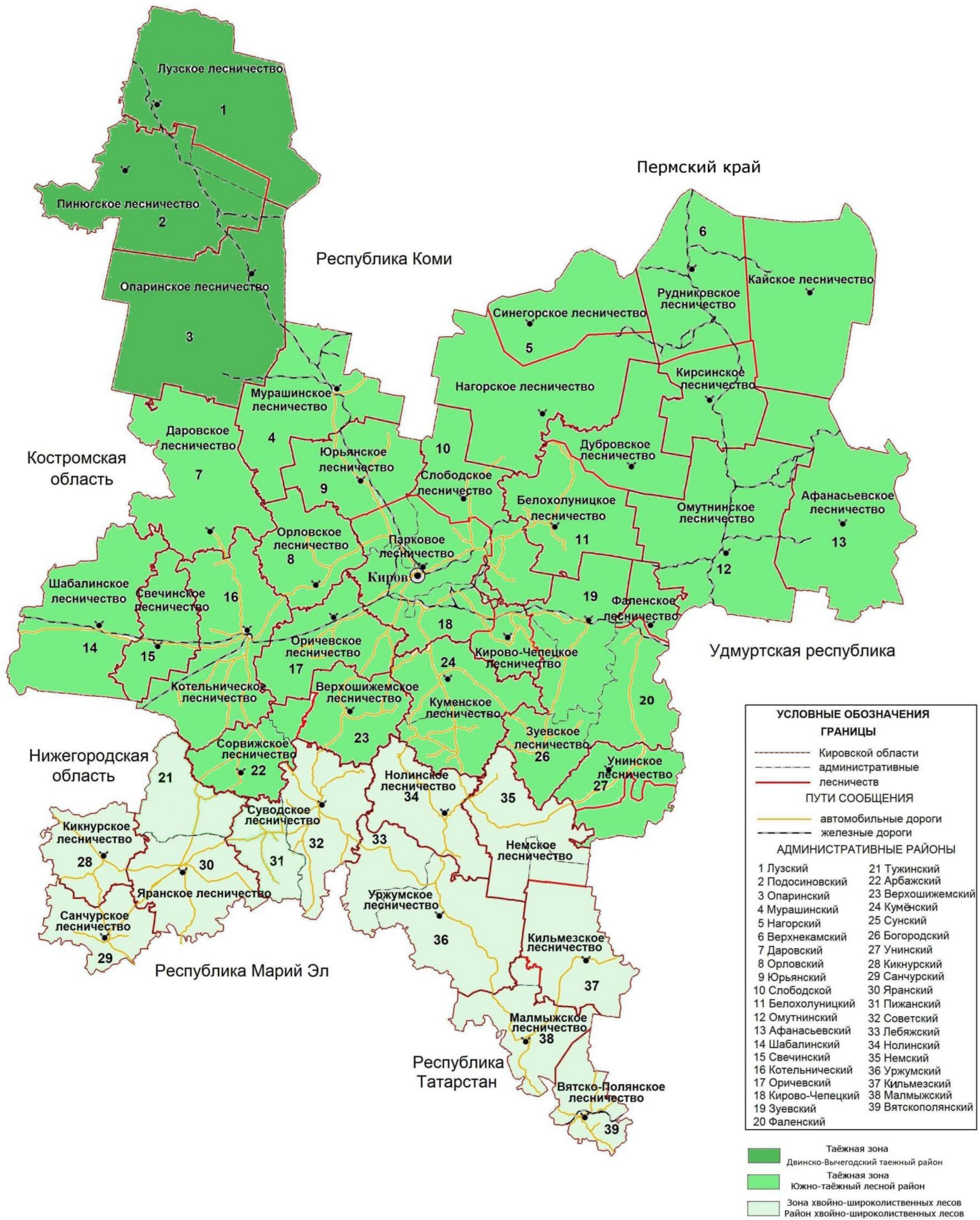
Рисунок 3. Распределение территории лесничеств Кировской области по лесорастительным зонам и лесным районам

распределения лесов лесничеств Кировской области по лесорастительным зонам и лесным районам