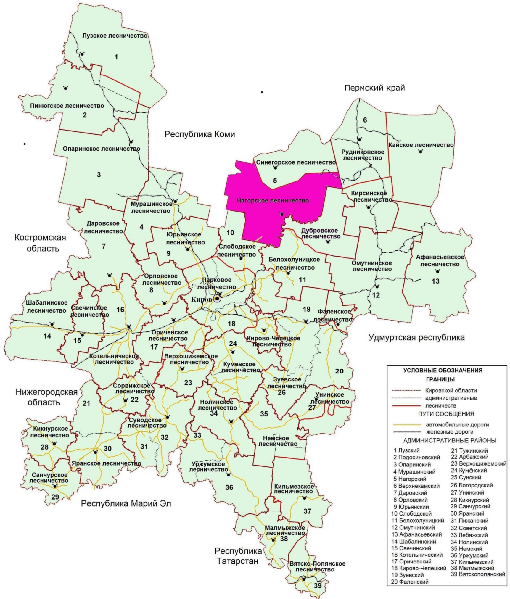
Рисунок 1. Карта-схема Кировской области с выделением территории Нагорского лесничества