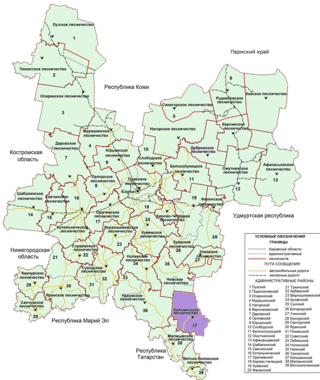
Рисунок 1. Карта-схема Кировской области с выделением территории Кильмезского лесничества