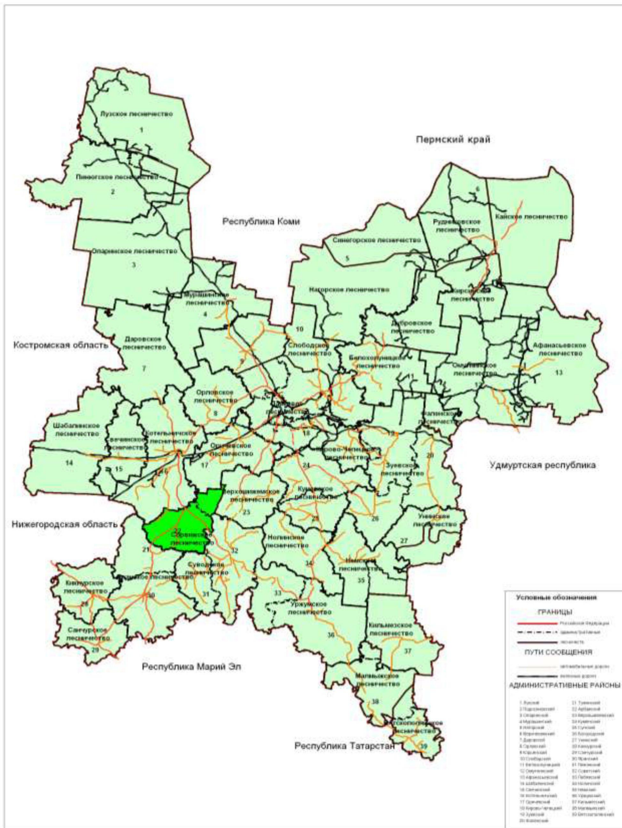
Рисунок 1. Карта – схема Кировской области с выделением территории Сорвического лесничества