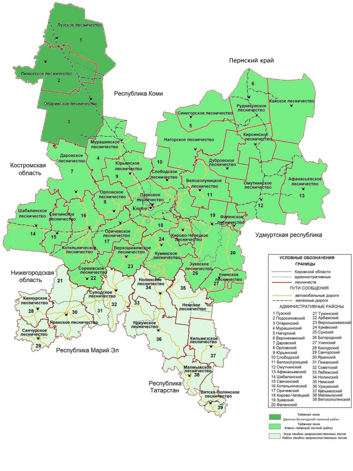
Рисунок 3. Распределение лесов лесничеств Кировской области по зонам и районам

распределения лесов лесничеств Кировской области по лесорастительным зонам и лесным районам