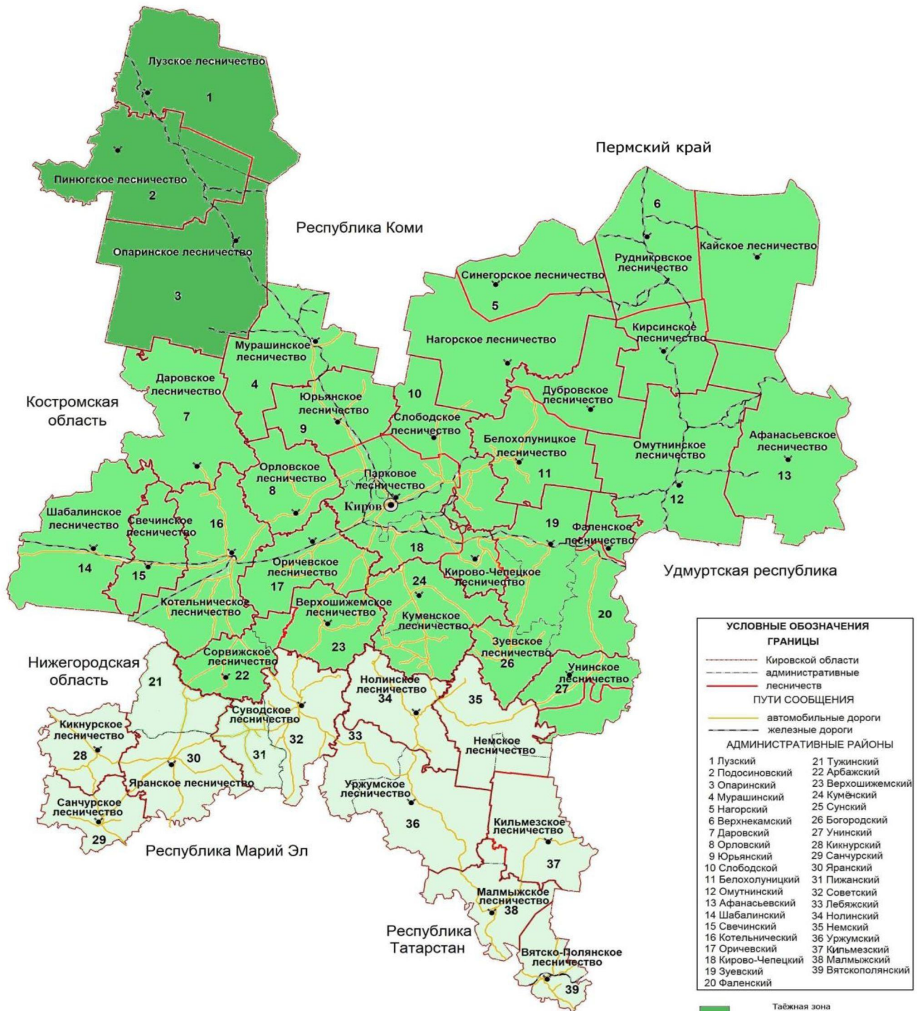
Рисунок 3. Распределение лесов лесничеств Кировской области по лесорастительным зонам и лесным районам

распределения лесов лесничеств Кировской области по лесорастительным зонам и лесным районам