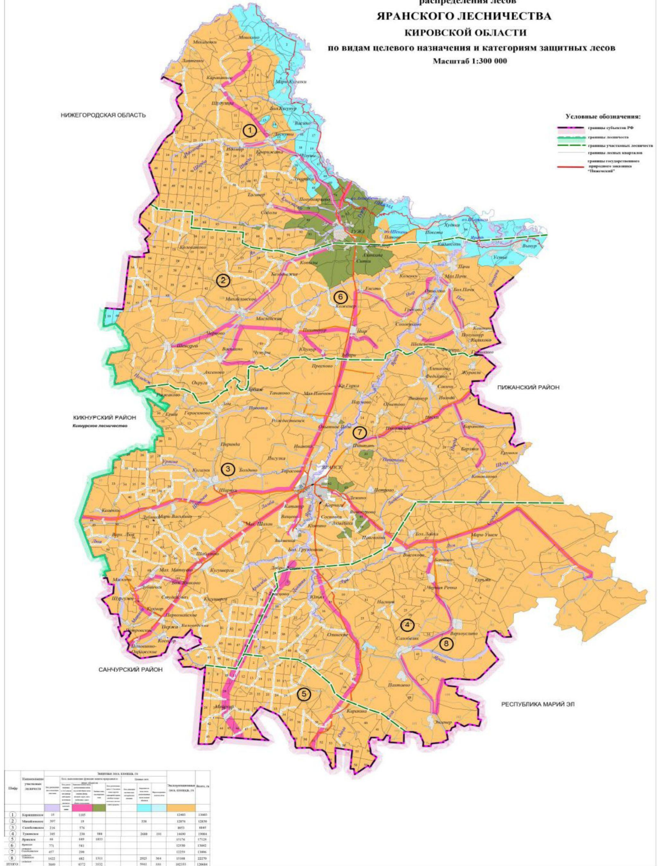
Рисунок 4. Поквартальная карта-схема подразделения лесов по целевому назначению

по видам целевого назначения и категориям защитных лесов Масштаб 1:300 000