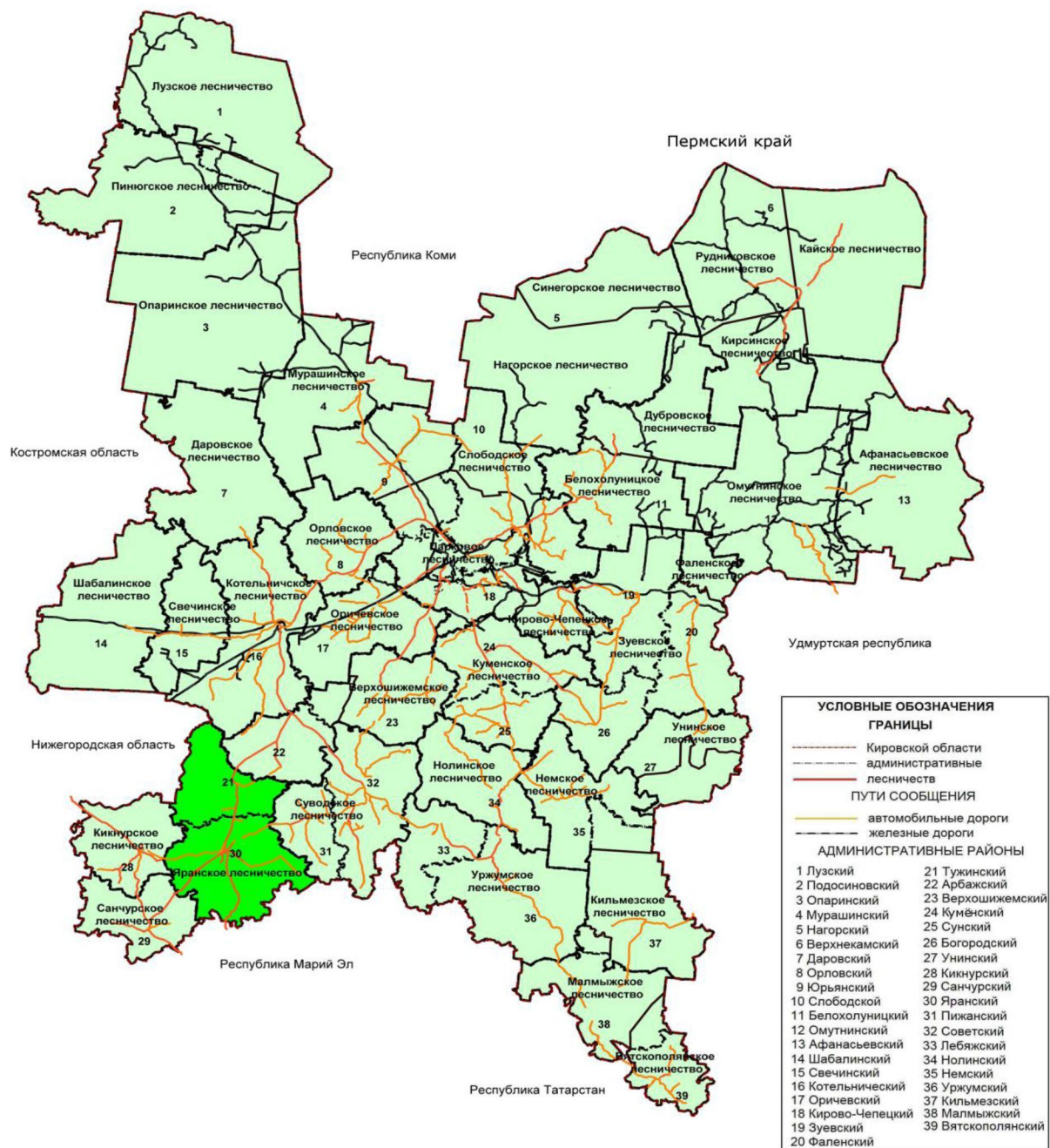
Рисунок 1. Карта-схема Кировской области с выделением территории расположения Яранского лесничества