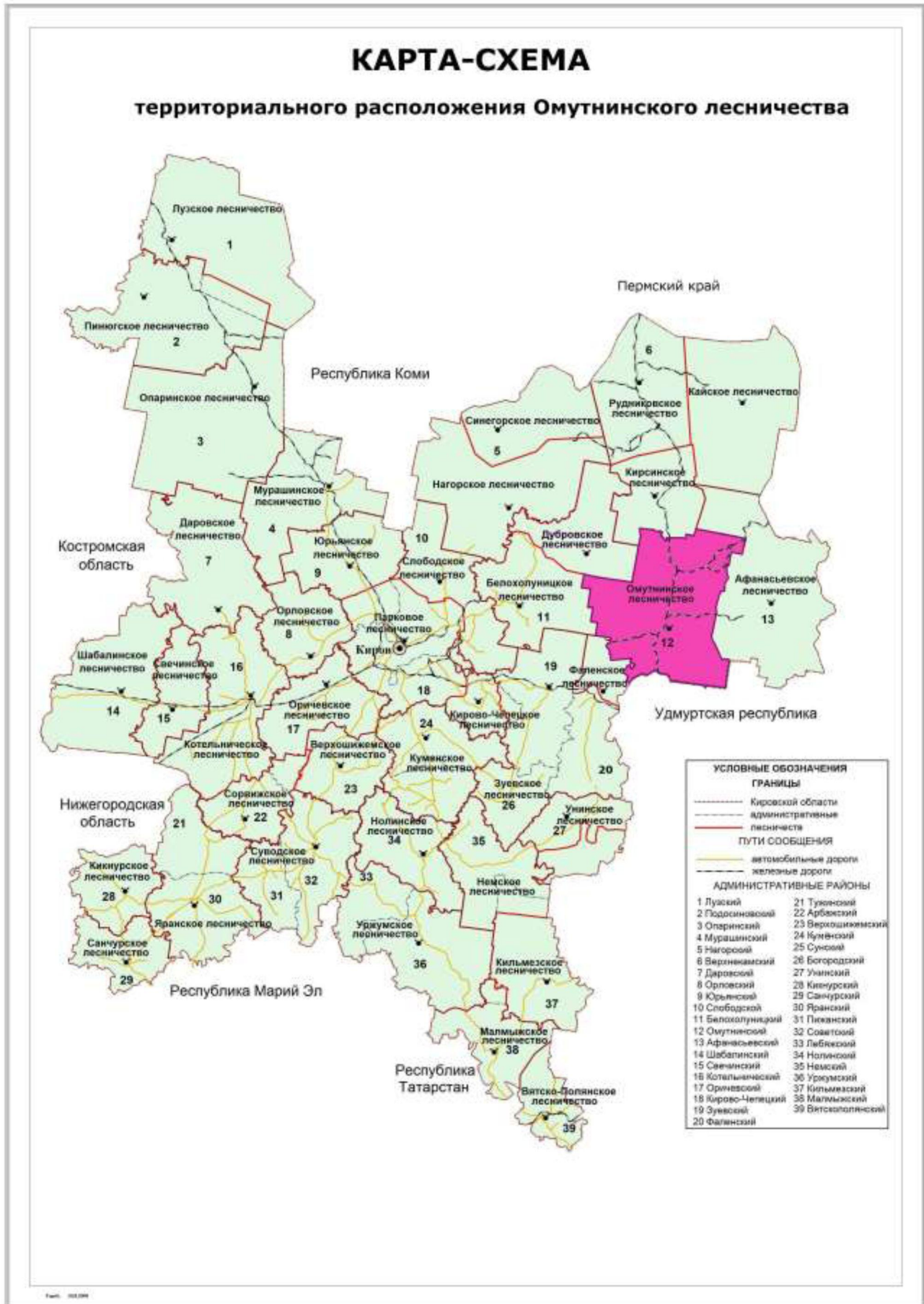
Рисунок 1. Карта-схема Кировской области с выделением территории Омутнинского лесничества