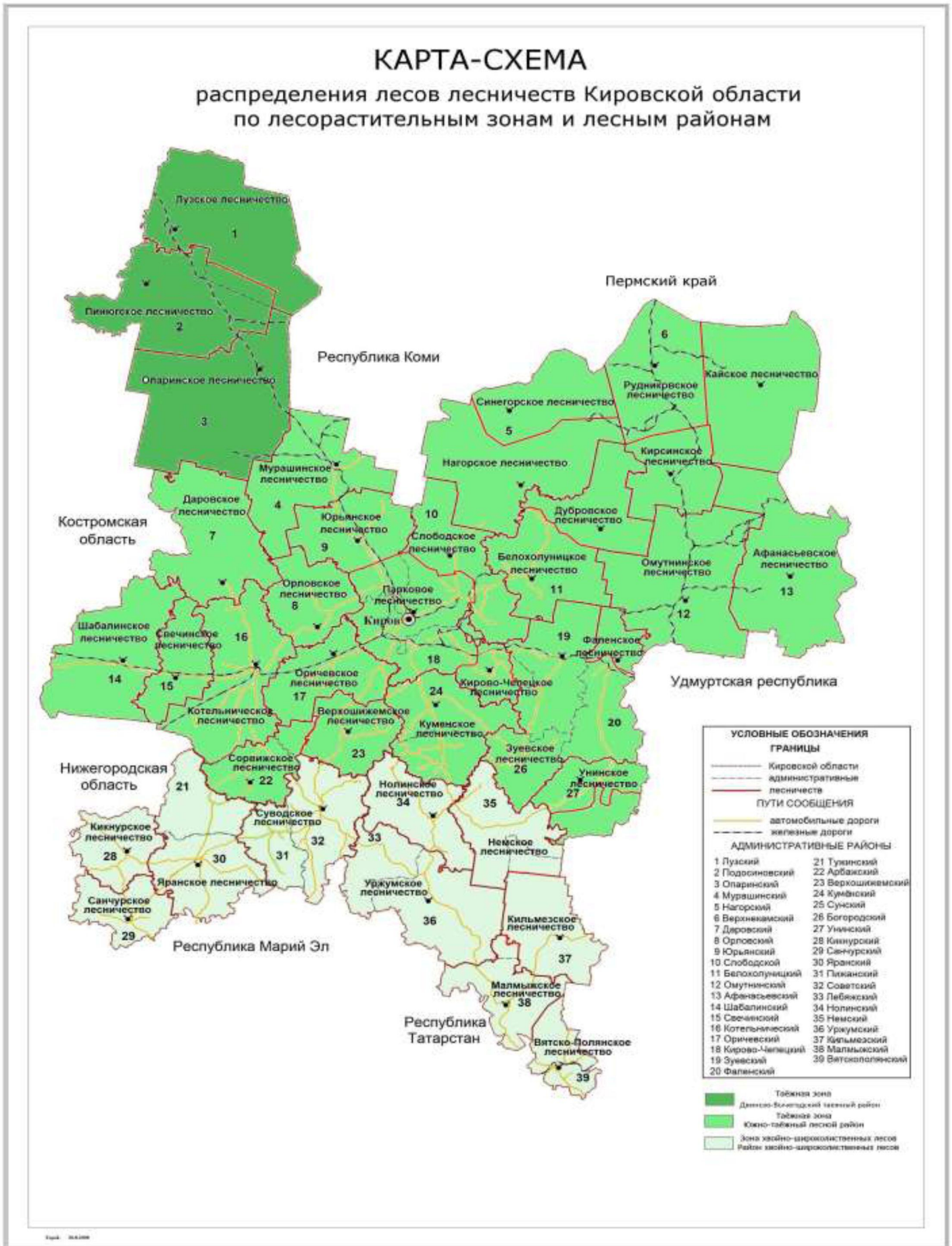
Рисунок 3. Распределение лесов Кировской области по лесорастительным зонам и районам