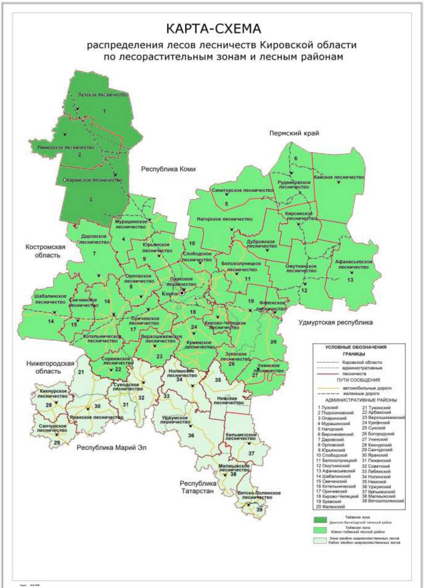
Рисунок 3. Распределение территории лесничеств Кировской области по лесорастительным зонам и лесным районам