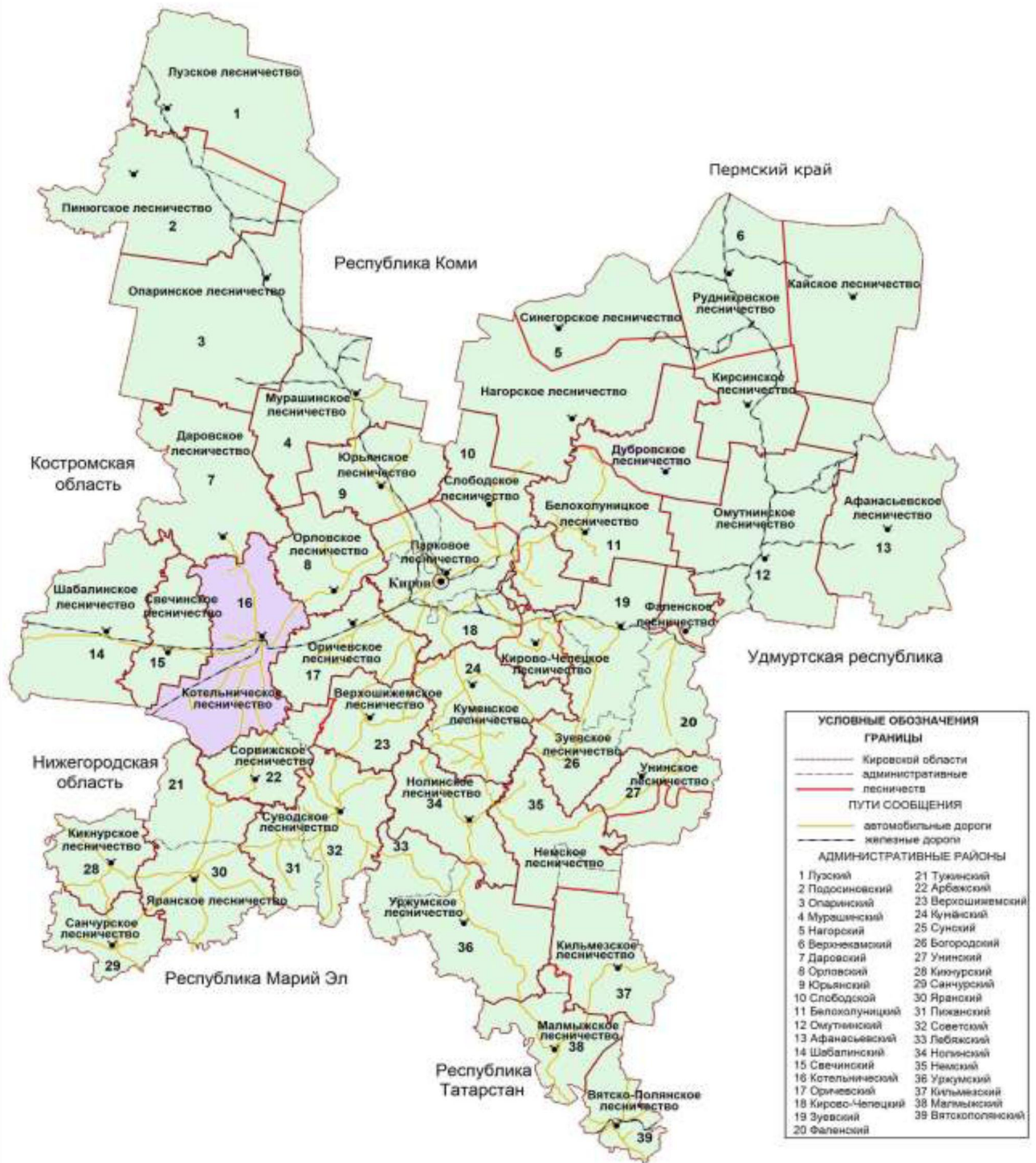
Рисунок 1. Карта-схема Кировской области с выделением территории Котельничского лесничества