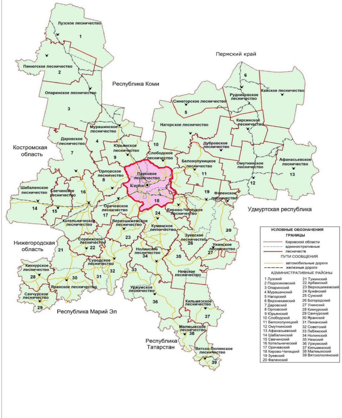
Рисунок 1. Карта-схема Кировской области с выделением территории Паркового лесничества

Территориального расположения Паркового лесничества