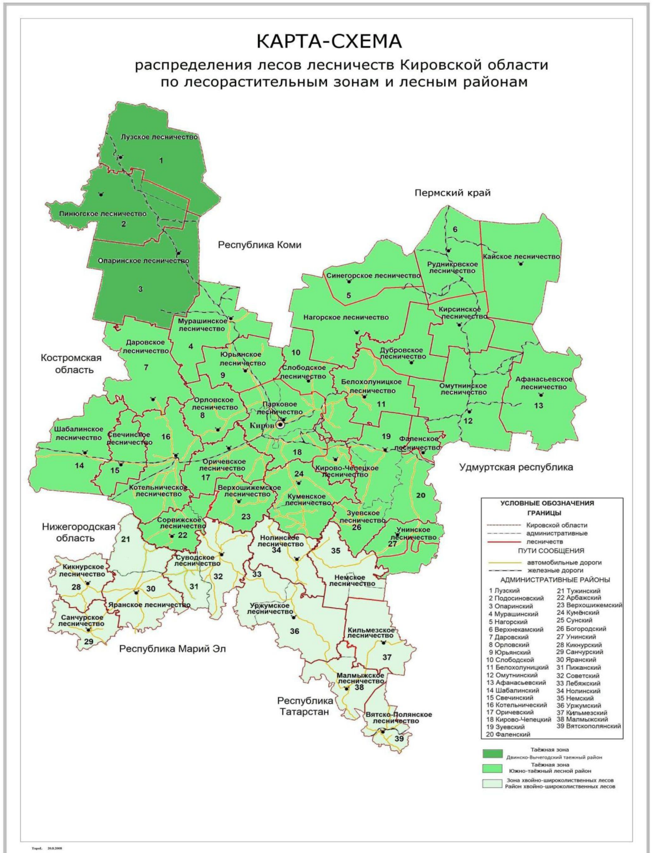
Рисунок 2. Распределение лесов лесничеств Кировской области по зонам и районам