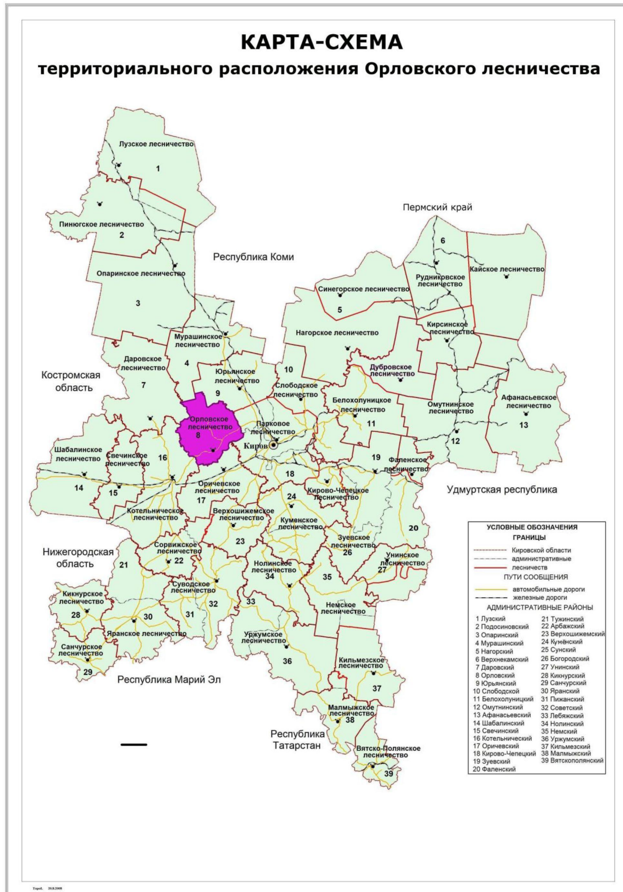
Рисунок 1. Карта-схема Кировской области с выделением территории Орловского лесничества