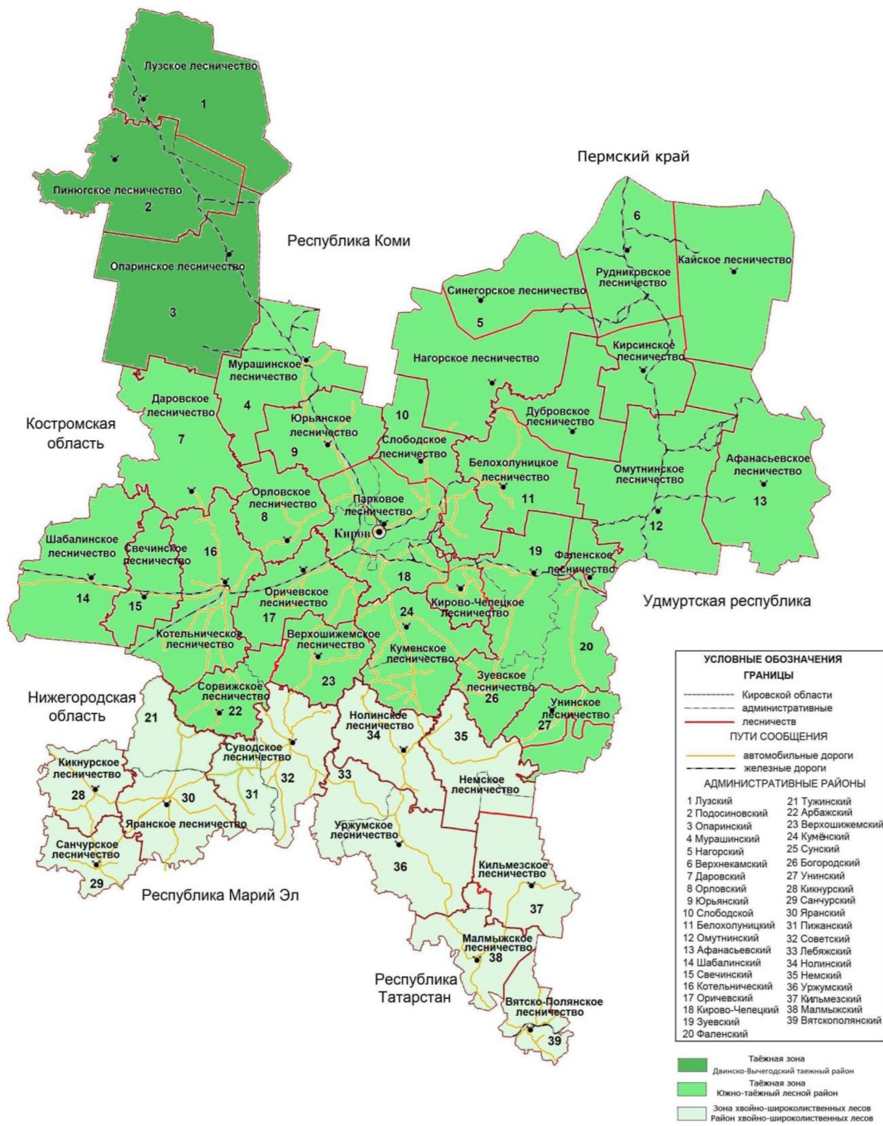
Рисунок 2. Распределение лесов лесничеств Кировской области по лесорастительным зонам и лесным районам

распределения лесов лесничеств Кировской области по лесорастительным зонам и лесным районам