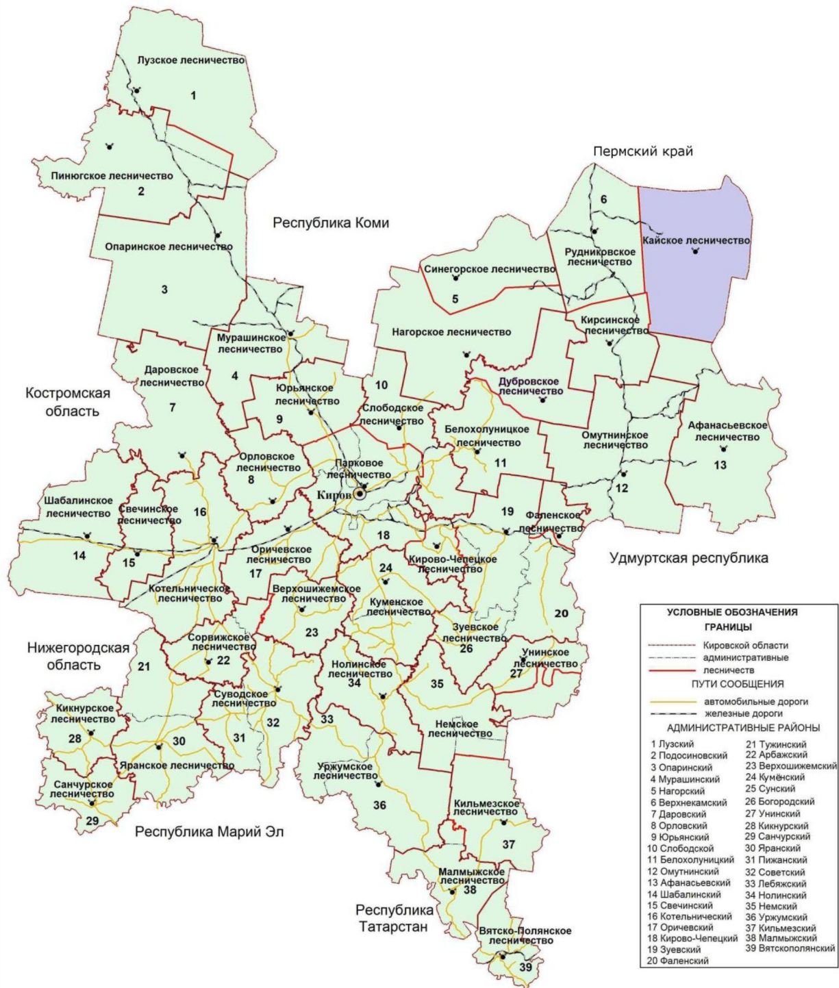
Рисунок 1. Карта-схема Кировской области с выделением территории Кайского лесничества