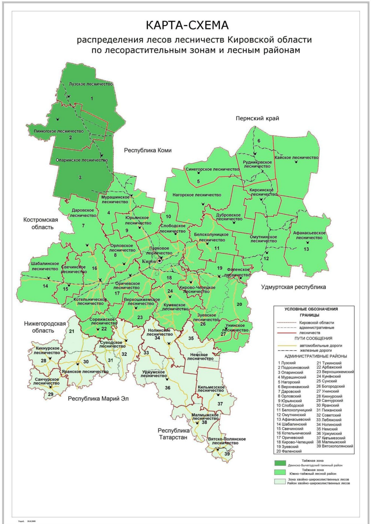
Рисунок 3. Распределение лесов лесничеств Кировской области по зонам и районам