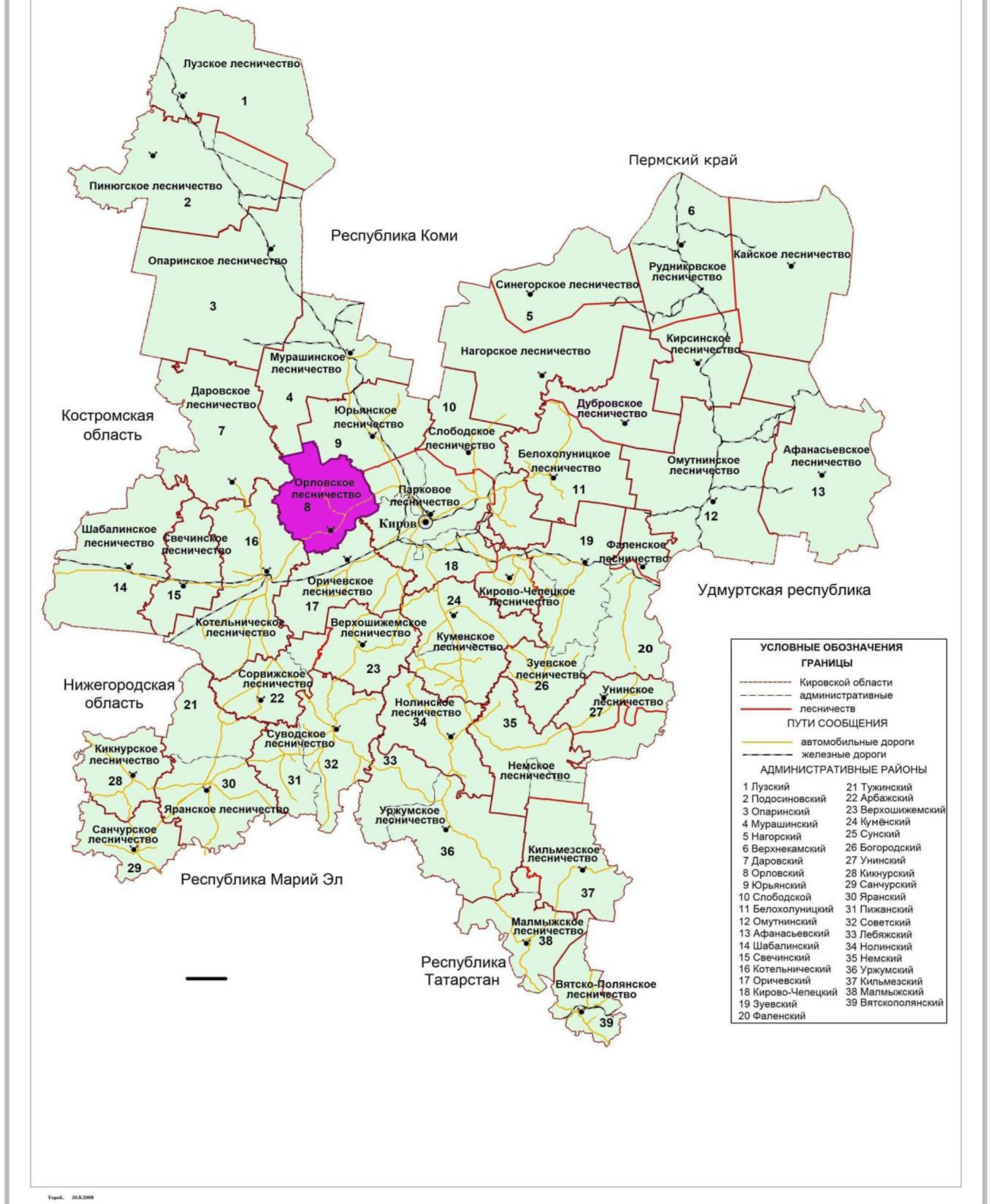
Рисунок 1. Карта-схема Кировской области с выделением территории Орловского лесничества